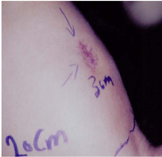
شکل ۲. تصویر اسکار ضایعه در مرکز توده