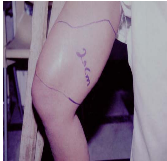
شکل ۱. نمای داخلی زانو و ران - توده منتشر اطراف دیستال فمور

جابه جا کرده و به طور منتشر دارای توده‌های هیپراکو بود. این توده در مجاورت لایه‌های عضلانی عمقی قرار گرفته و احتمال ارتباط آن با عروق وجود داشت. تشخیص‌های احتمالی مطرح شده در سونوگرافی ساده، واکنش به جسم خارجی، هماتوم ارگانیزه شده و آنوریسم کاذب را شامل می‌شد.