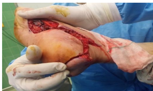
شکل ۵. جای گذاری فلاپ به روی نقص اولیه