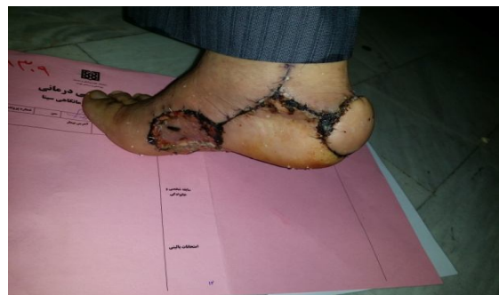
شکل ۶. تصویر فلاپ ۱ ماه پس از جراحی