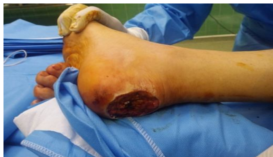
شکل ۲. نقص بافتی حاصله پس از اکسیزیون تومور

بود. سابقه ۱۵ ساله مصرف سیگار، سابقه جراحی کاتاراکت چپ و هرنی چپ و سابقه MI و HTN نیز گزارش شد. هم‌چنین سابقه مصرف تریامترن و آتروواستاتین، دیگوکسین، کارودیلول و قطره بتامتازون و نفازولین عنوان شد. این بیمار به علت زخم بدخیم تحت بیوپسی زخم پاشنه قرار می‌گیرد که در پاتولوژی مالیگنانت ملانوما گزارش می‌شود.