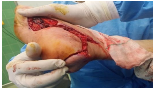
شکل ۵. جای گذاری فلاپ به روی نقص اولیه