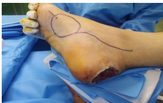
شکل ۳. طراحی فلاپ در ناحیه عدم تحمل وزن