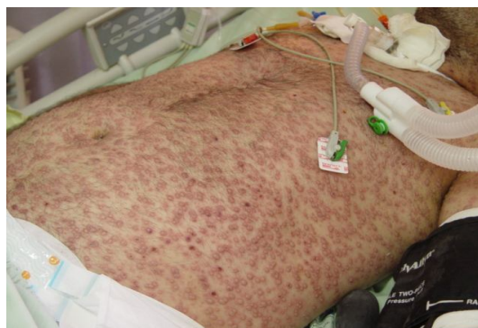
1. ضایعات بیمار قبل از درمان

وزیکول‌های گروهی با اریتم اطراف با اندازه‌های یکسان در سر و صورت، تنه و اندام‌ها دیده شد که تعدادی از آنها در مرکز نافدار بودند (شکل 1). در مخاطها (چشم - دهان - ژنتالیا) ضایعه‌ای دیده نشد. در آزمایشات انجام شده تنها لکوسیتوز و کم خونی رویت شد. تست‌های کبدی طبیعی و مارکرهای هپاتیت و ایدز منفی بود (جدول 1). CXR نرمال گزارش شد. در سونوگرافی شکم یافته غیر طبیعی دیده نشد. بررسی از نظر سپسیس (Sepsis) و علل عفونی تب منفی بود. بیمار در حین بستری به علت پنومونی اسپیراسیون تحت درمان آنتی بیوتیکی قرار گرفت و با وجود دریافت آنتی بیوتیک و بهبودی علائم، تب بیمار هم چنان ادامه داشت. بیمار استروئید دریافت نکرده بود.