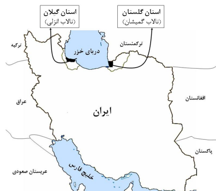
نقشه ۱: مناطق مورد مطالعه پرندگان در دو زیستگاه شرقی و غربی دریای خزر

در این مطالعه مقطعی دو تالاب انزلی و گمیشان در سواحل جنوبی دریای خزر انتخاب شدند، که هر دوی این تالاب‌ها در کنوانسیون رامسر به ثبت رسیده و دارای ارزش بین‌المللی هستند که هر سال در فصل زمستان پذیرای گونه‌های زیادی از پرندگان مهاجر وحشی می‌باشند (نقشه ۱).