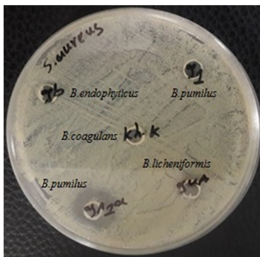
شکل ۲. نمونه‌ای از پلیت چاهک‌گذاری شده برای تعدادی از سوبه‌ها در مقابل استافیلوکوکوس اورئوس

همان‌طور که در شکل مشاهده می‌شود باسیلوس پومیلوس و به مقدار کمی باسیلوس لایکنی فورمیس رشد استافیلوکوکوس اورئوس را مهار کرده‌اند.