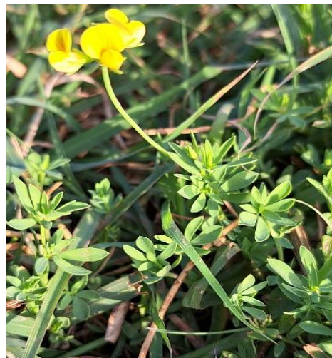
شکل ۱. گیاه L. corniculatus

لرستان، خراسان، تهران، سمنان و خوزستان پراکنش دارد (۱۵).